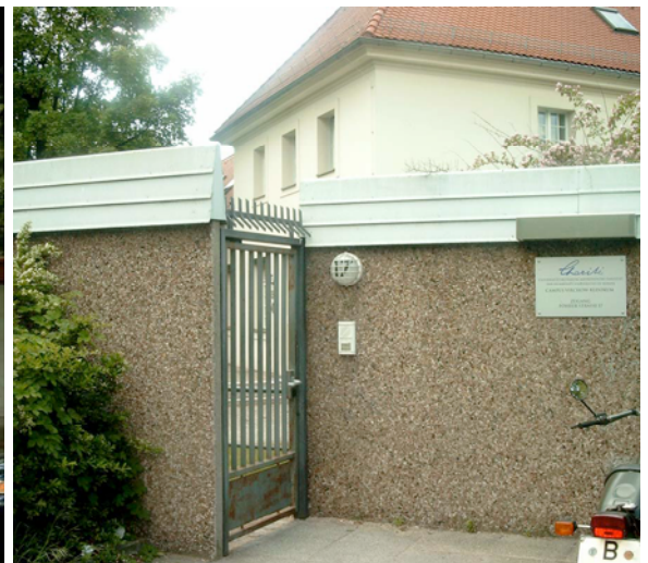
Eingang Charité-CVK Föhlerstr. 17