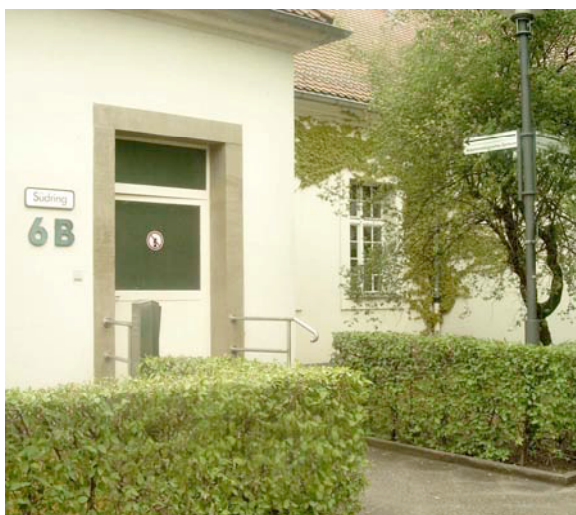
Südring 6B, Eingang AMZ