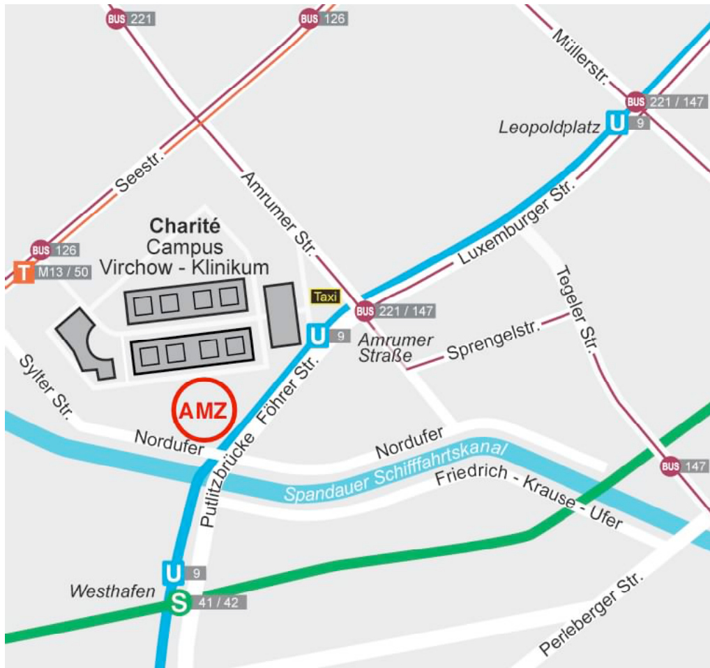
Anfahrtswege zum Campus Virchow-Klinikum der Charité