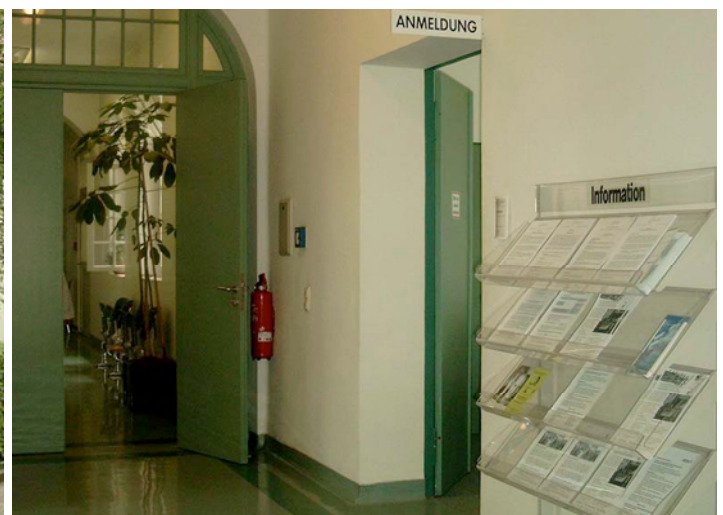
Im AMZ: Anmeldung