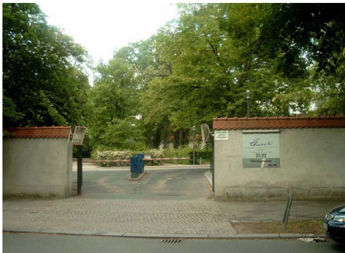
Einfahrt Charité-CVK Nordufer 21/22

Bus: Linien 106 (Seestraße) 147 und 221 (Augustenburger Platz)